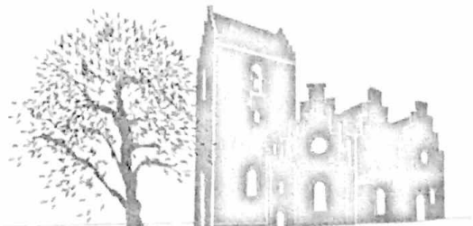
Sankt Katharina kirke